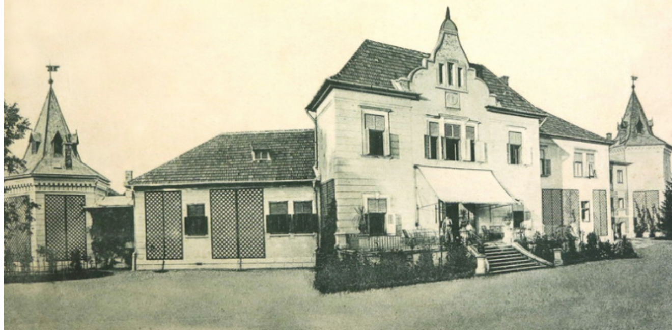
(Text și foto : Primăria Beclean)