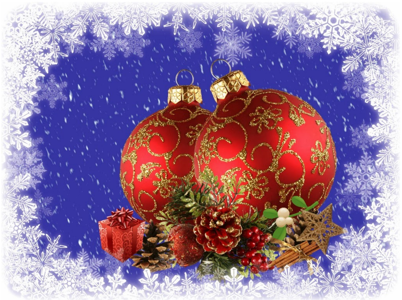
CONSILIUL LOCAL NUȘENI